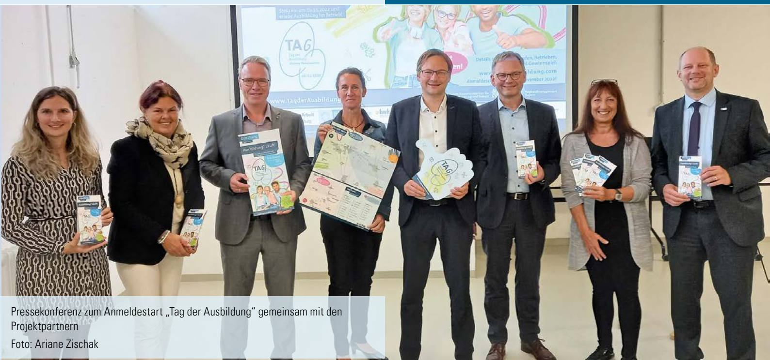
Pressekonferenz zum Anmeldestart „Tag der Ausbildung“ gemeinsam mit den Projektpartnern