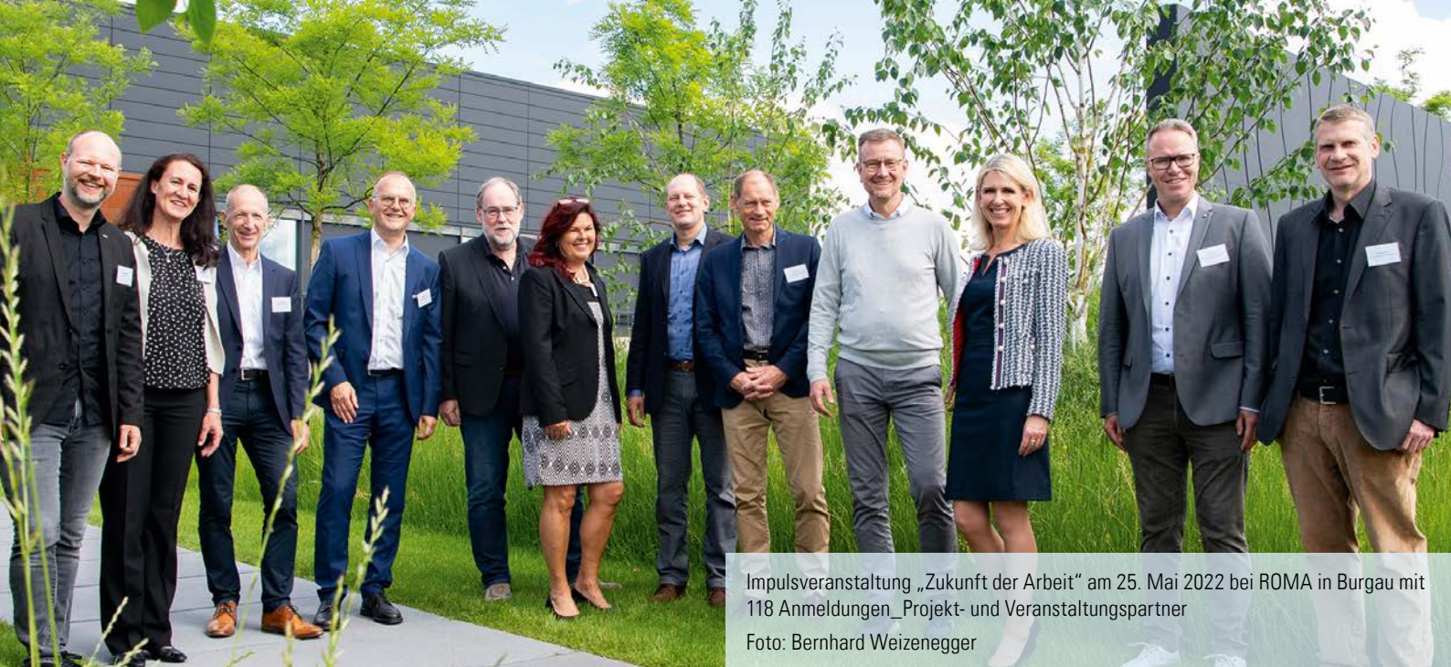
Impulsveranstaltung „Zukunft der Arbeit“ am 25. Mai 2022 bei ROMA in Burgau mit 118 Anmeldungen_Projekt- und Veranstaltungspartner